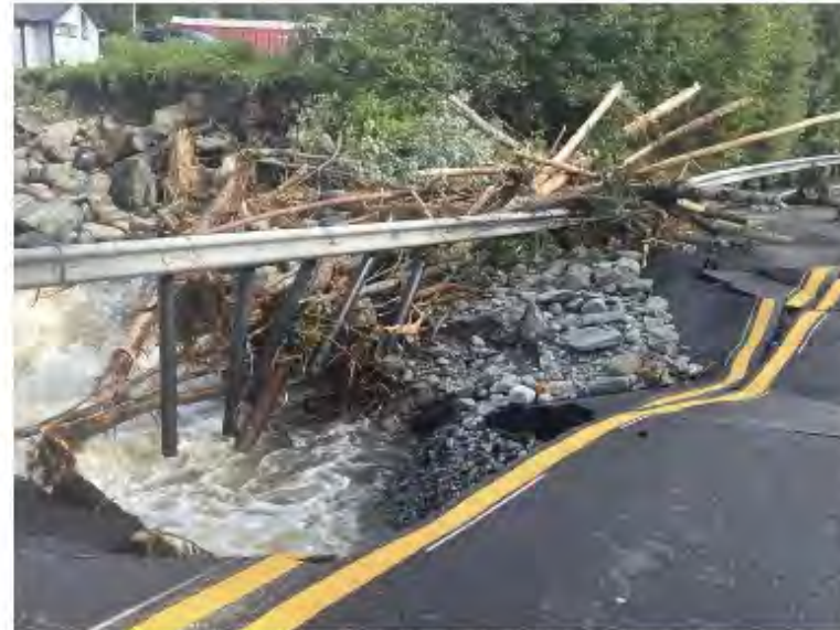
Slik ser riksvei 7 i Hallingdal ut torsdag. Veien er åpen igjen for kjøretøy under 7,5 tonn.

Flere jernbanestrekninger er også stengt. Ifølge VY går det nå tog mellom Oslo S og Gardermoen igjen.