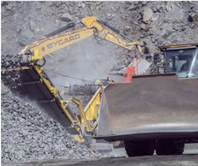
Oddvar Øygard sin pukkverksvirksomhet i Hallingdal ble en del av beredskapen da viktig infrastruktur måt bygges opp igjen etter ekstremværet «Hans».