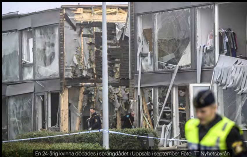
En 24-årig kvinna dödades i sprängdådet i Uppsala i september.

De kriminella sprängningarna har förändrat spelplanen för såväl verksamheterna, våra myndigheter samt samhället i stort.